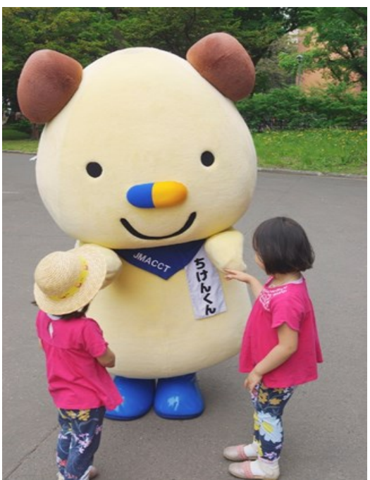
日本医師会治験促進センターのキャラクターちけん君も遊びに来てくれました！